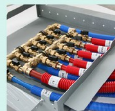
Coffret de distribution