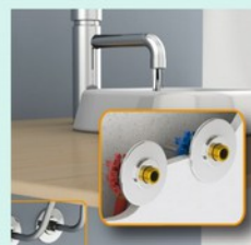
Raccordement et finition